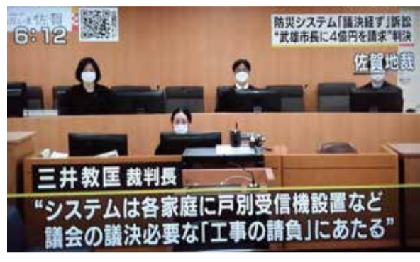
2022年11月18日のNHK テレビから (上、下写真)

1審佐賀地裁の判決で「武雄市 議会の議決に付すべき契約及び財 産の取得又は処分に関する条例」