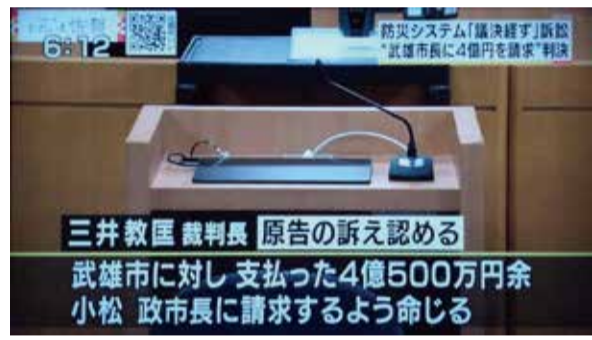
佐賀地裁は、武雄市に対しK社に支払った4億548万6620円を小松市長に請求するよう命じる原告勝訴の判決をくださった。

市民の声からは、「議会は後から 追認すればいいなら議会は要らな いよ。ひでえ話だ」と。